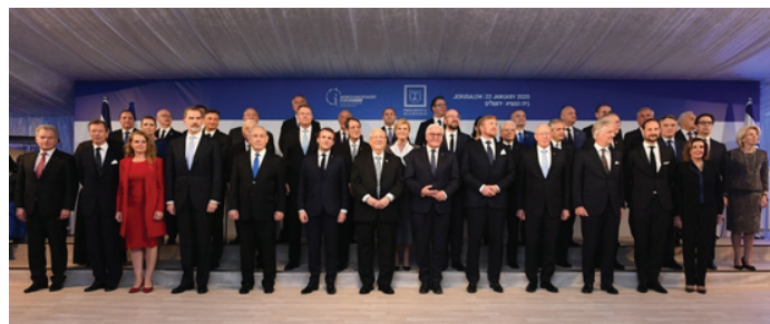
התמונה המשותפת של כל המנהיגים בסיום האירוע