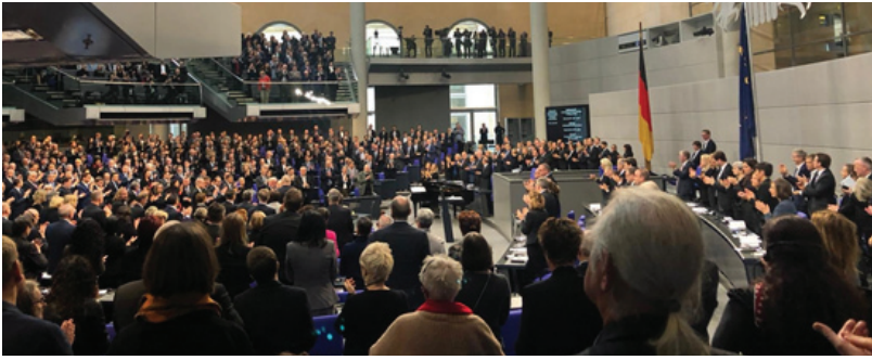
התשואות הממושכות בפרלמנט הגרמני